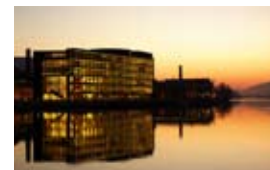
Kunskapsparken i Drammen innehåller lokaler för 900 högskoleelever. NVS har utfört installationer för värme, sanitet, sprinkler, kyla och snösmältanslaggningsanläggning.