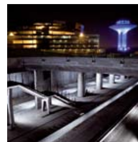
NVS utför omfattande installationer i samband med Citytunnelprojektet i Malmö. Projektet omfattar installationer för värme och sanitet samt brandsläckning vid stationerna och i tunnlnarna.