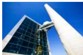
I kraftvärmeverket Torsvik utanför Jönköping utförde NVS installationer för värme och sanitet, styr, ventilation samt rökgasrening.