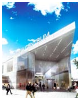
Sollentuna Centrum genomgår en större om- och utbyggnad där NVS utför installationer för värme, sanitet och kyla.